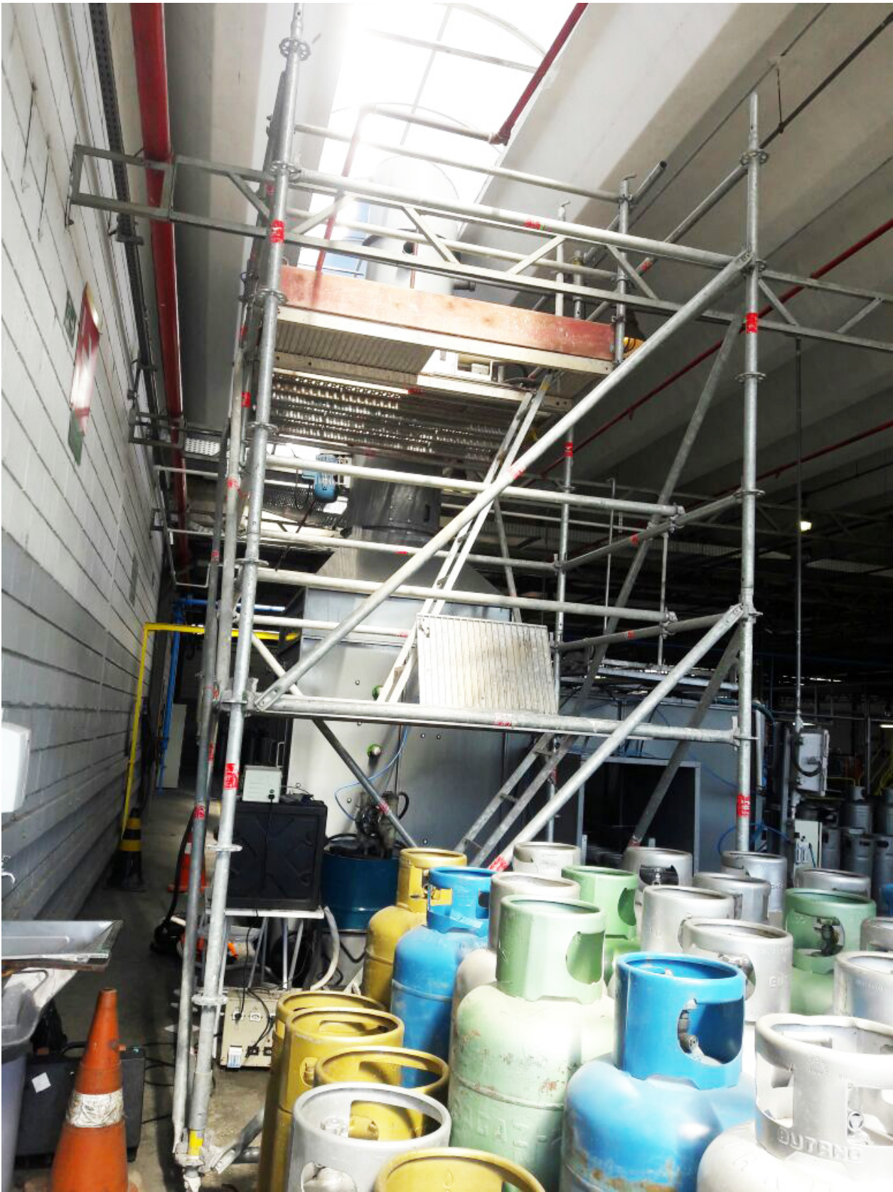
O andaime foi