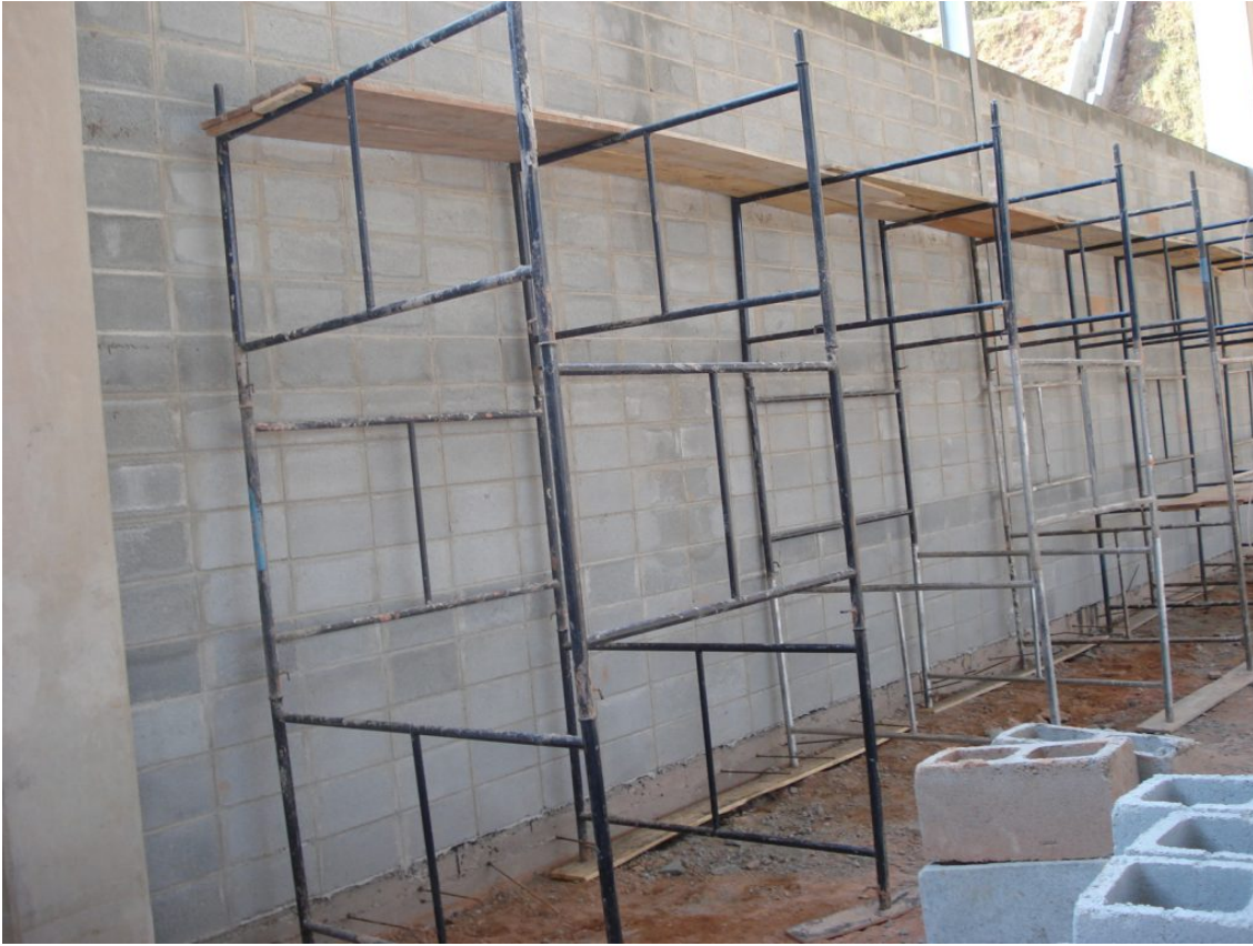
Andaimes de encaixe.