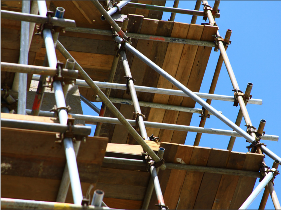
Andaime tubo e braçadeira.